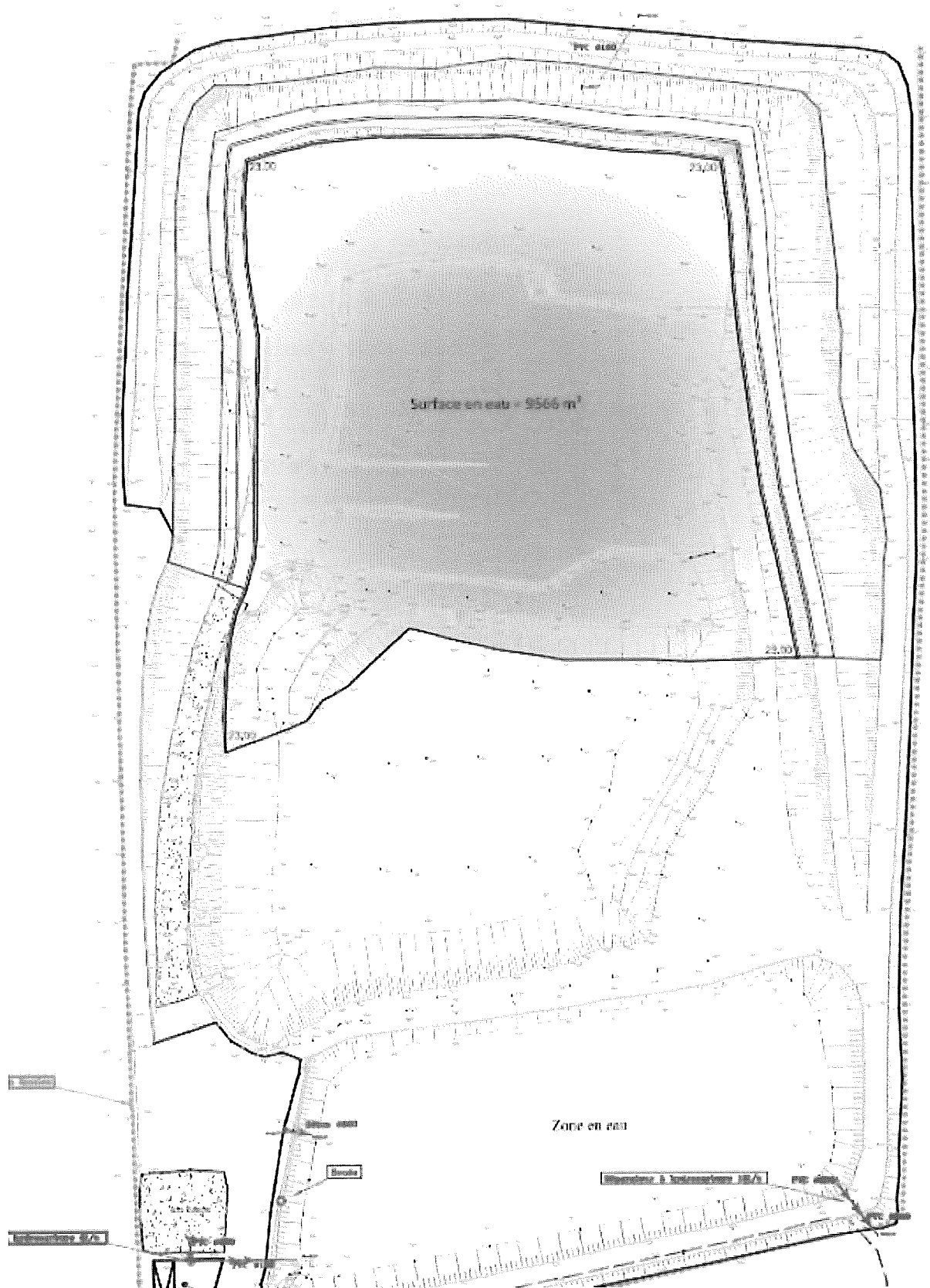
Figure 1 : Phase 1